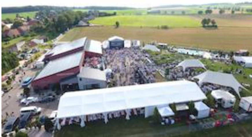
Schlagernacht in Weiß